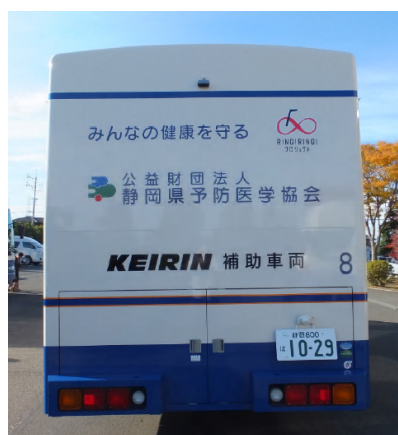
胃がん検診車後部