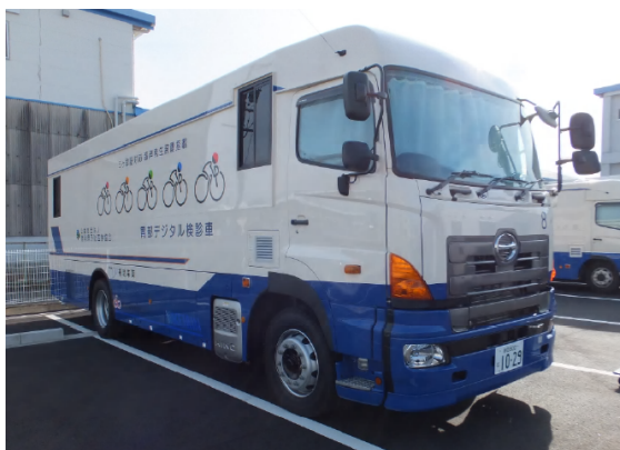
胃がん検診車右前