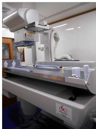
聴覚障がい者向け検診システム