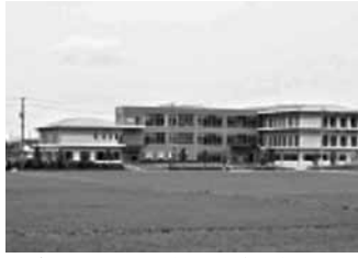
介護老人福祉施設 梅香の里