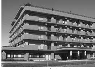
ケアハウス あんしんの里

「ケアハウスあんしんの里」「介護老人福祉施設梅香の里」を開設して行き浜松市と磐田市で四つの高齢者介護施設を経営しています。それぞれの施設は浜松