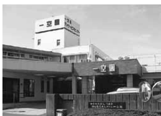
介護老人福祉施設 一空園

社会福祉法人八生会は社会福祉事業を行う事を目的として一九八四年六月に浜松市東区安新町の地に創設されました。「八生会」という名称は仏教の教えで修業の実践徳目である「八正道」に由来しています。翌年の四月一日に「介護老人福祉施設一空園」を開設して以来、高齢化社会の到来に