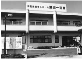
介護老人福祉施設 豊田一空園