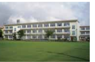
りするよい機会となりました。

本校の児童数は5月末現在699名、23学級です。外遊びの好きな子が多く、1時間目と2時間目の間のロング休みや昼休みには、たくさんの児童が運動場や中庭で元気よく遊んでいます。本校の特色の一つとして、県内でも珍しい芝生の運動場があり、休み時間にはサッカーや鬼ごっこをする子に混ざって、芝生の上に寝転がる子どもたちの姿が見られます。初めて芝生の上を歩いたときの「ふかふかして気持ちいい。」