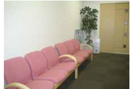
1F レディース健診フロア

1階のレディース専用健診フロアでは婦人科検診・乳がん検診・マンモグラフィー検査を実施しています。婦人科検診を受診される方は、普段と違う環境で不安なことも多いかと思いますが、レディース専用健診フロアの落ち着いた空間でゆったりと検診を受けることができます。