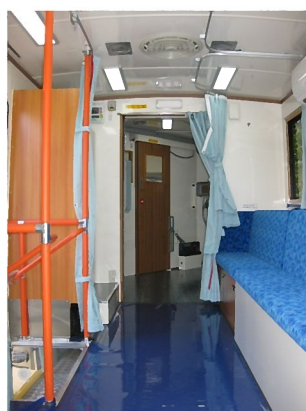
バリアフリーな車内設計