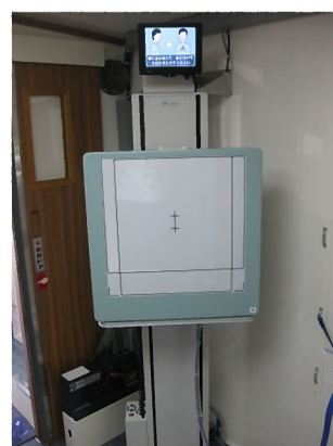
電動式立位撮影台