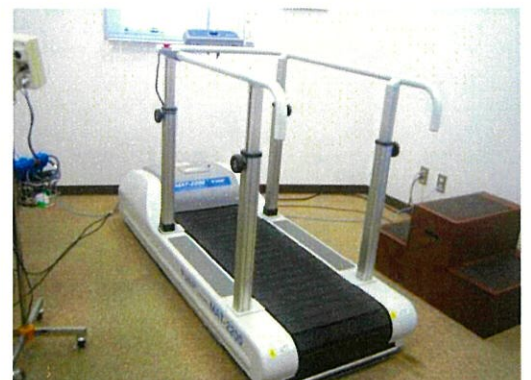
トレッドミル装置(中央)とマスター用階段(右)