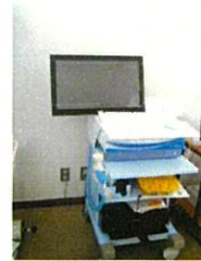
スパイロメーター

肺に出入りする空気の換気機能を調べることで、気管支喘息・肺気腫・COPD(慢性閉塞性肺疾患)などの肺の病気が疑われる疾患がないかを調べます。