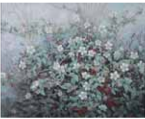
【日本画部門】「草いちご」