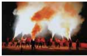
【写真部門】「3年ぶりに舞い踊る」