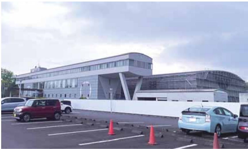
ふじのくに感染症管理センターの始動 静岡県では、コロナ対応に取り組む中で医療従事者や感染症専門家のご意見を受けて、コロ

国内でこれまで報告がなかったサル痘(M痘)が海外から持ち込まれ、天然痘ワクチンを接種していない40歳代以下を中心に令和5年から国内で増加中です。令和4年に小児の原因不明の