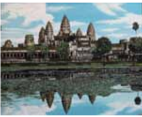
【工芸部門】「春のアンコールワット」