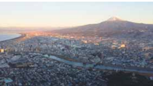
香貫山展望台上空からの富士山

【職員の健康管理】職員の健康状態の把握、疾病予防のために、毎年全職員に対して健康診断を実施し、年齢該当者等のうち希望する職員に対しては各種がん検診等も実施しています。 健康診断の結果で再検査等が必要となった職員に対しては、所属長からすみやかに受診するよう指導し、併せて受診結果報告書の提出を求め、疾病の早期発見・早期治療に繋げるよう努めています。 その他、職種や業務内容に応じた予防接種の