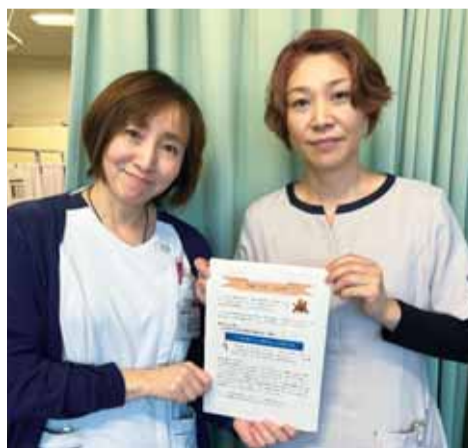
「医務室だより」(看護師作成)による職員向け情報発信

令和5年7月1日に市制施行一〇〇周年の記念すべき節目を迎えた沼津市は、首都100キロメートル圏に位置する静岡県東部にあって恵まれた自然環境と優位な地理的条件のもとで、東駿河湾地域、伊豆方面への交通拠点あるいは広域的な商業・文化拠点として、古くからこの地域の政治、経済、文化の中心的役割を担ってきました。 奥駿河湾越しに見る富士山、緑濃い千本松原、香貫山、街の中心部を滔々と流れる狩野川などの豊かな自然とその景観は、多くの文人たちを輩出すると同時に、新鮮で豊富な魚温暖な気候と豊かな土