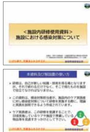
図4 掲載資料(施設内研修資料)

新型コロナウイルスの際には、社会福祉施設や医療機関等でクラスターが多く発生したことから、県では社会福祉施設等の感染症に対する対応力の向上に取り組んでいます。会場やオンラインで行う研修のほか、施設内研修や施設内訓練を実施するための資料(図4)や手指消毒などの動画(図5)、アクションカード