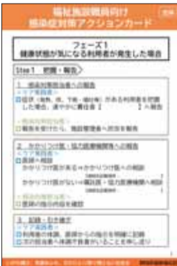
図6 アクションカード