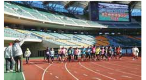
すこやか長寿祭スポーツ・文化交流大会「マラソン」の様子

「ねんりんピック」は、スポーツや文化種目の交流大会を始め、健康や福祉に関する多彩なイベントを通じ、高齢者を中心とする国民の健康保持・増進、社会参加、生きがいの高揚を図り、ふれあいと活力ある長寿社会の形成に寄与するため、厚生省創立50周年に当たる昭和63(1988)年から毎年開催しています。