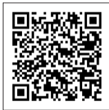
図3 感染症ダッシュボードの1例(インフルエンザの保健所別発生状況)

皆様の施設・事業所近辺のインフルエンザの流行状況といった表示も可能となっていますので、 自施設内での感染症情報の周知などに活用ください。