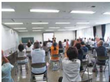
健康づくり講習会 運動

保健指導は、生活習慣病予防の観点から、二十歳〜三十歳代への予防的な関わりを強化しています。新規採用時等職員研修で若い頃からの心身の健康管理について啓発すると