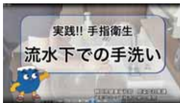
図5 掲載資料(手指消毒動画)

皆様の施設・事業所でもこれらのツールを活用して、感染症対応力の向上に取り組んでいただくようお願いいたします。